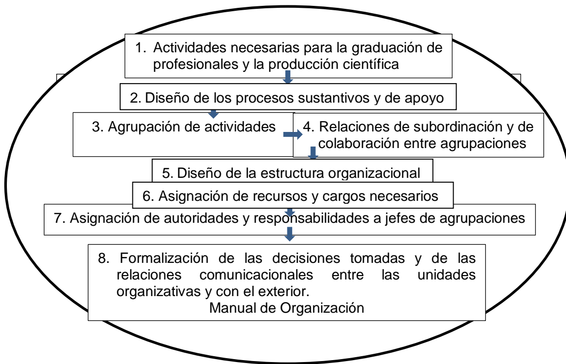
Gráfico No. 2 – Componentes o subsistemas del Sistema Organizativo de una IES.

En el primer sentido, deben seguirse los componentes del sistema organizativo diseñado por el autor del presente artículo, tomando como base el esquema organizacional del citado autor Henry Mintzberg, según se muestra en el gráfico siguiente: